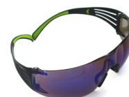
3M™ SecureFit™ 400, PC – blå spejlrefleks